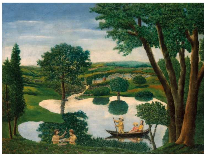
Promenade en barque

La promenade culturelle initiée présente 13 reproductions de tableaux de l'artiste répartis dans plusieurs lieux de la ville ; une invitation pour les habitants et les touristes à (re)découvrir l'œuvre d'André Bauchant dans sa ville natale.