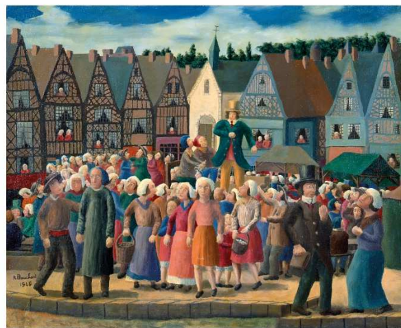
Le charlatan Tourangeau